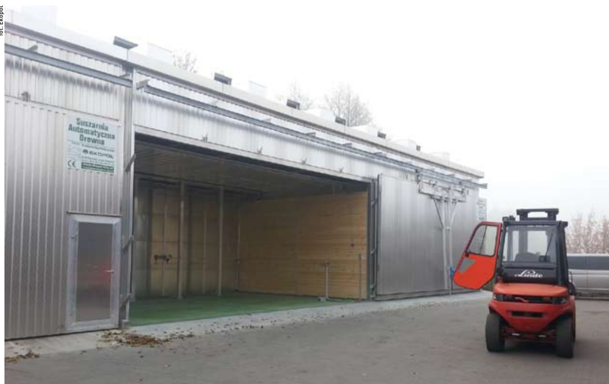
Suszarnia z systemem odzysku ciepła.

– Suszarnie i parzelnie EKOPOLU wyróżnia przede wszystkim solidna konstrukcja oraz zaawansowany układ sterowania, który jest obecnie prawdopodobnie najbardziej zaawansowanym sterownikiem do suszenia